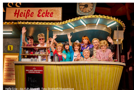
Heiße Ecke - das Kult-Musical!