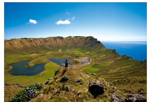
Auf den Azoren

22.09.2024 - 29.09.2024 - Hotel Azoris Royal Garden Reisepreis p.P. im DZ / bis 22.04. 2049 € Reisepreis p.P. im EZ / bis 22.04. 2481 €